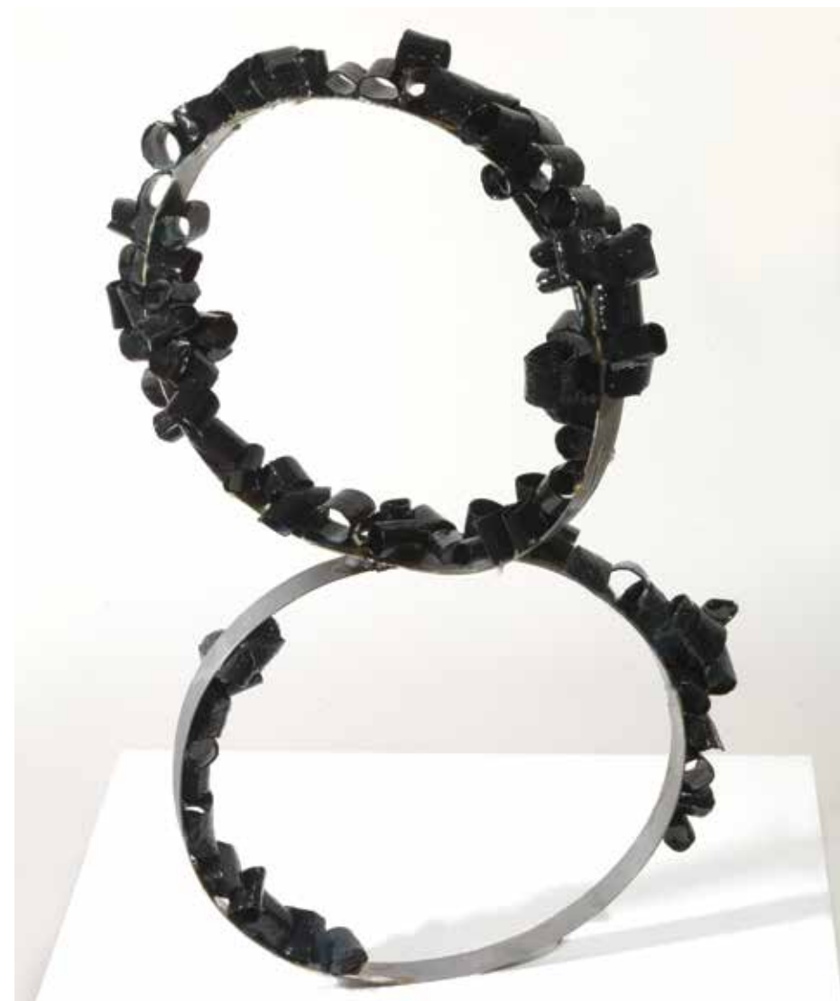
Bike Wheels Reconstructed