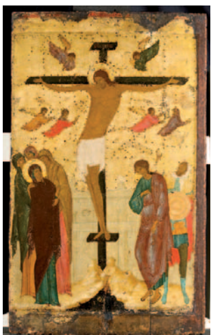
«Η Σταύρωση» του Dionisy.

Δίνοντας έμφαση στη στενή σχέση της ρωσικής θρησκευτικής τέχνης με τη βυζαντινή παράδοση, αλλά και στα σημεία διαφοροποίησης από τις βυζαντινές ρίζες, που αναδεικνύουν τον μοναδικό χαρακτήρα της, η έκθεση «Εικόνες από την Πινακοθήκη Τρετιακόφ. Η ρωσική ζωγραφική εικόνων μετά την Άλωση της Κωνσταντινούπολης» πραγματοποιείται στο Βυζαντινό και Χριστιανικό Μουσείο. Ενταγμένη στο πλαίσιο των πολιτιστικών εκδηλώσεων του αφιερωματικού έτους «Ρωσία - Ελλάδα 2016», η έκθεση θα εγκαινιαστεί από τον υπουργό Πολιτισμού και Αθλητισμού Αριστέδη Μπαλάτση σήμερα, στις 7.30 το απόγευμα, και θα διαρκέσει έως τις 25 Οκτωβρίου (Βασ. Σοφίας 22 - Αθήνα). Η έκθεση έρχεται να ενισχύσει τη γνωριμία των επισκεπτών του Βυζαντινού και Χριστιανικού Μουσείου με τη ρωσική θρησκευτική ζωγραφική, σε συνέχεια της συν-