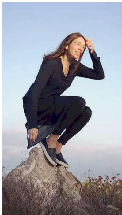
Η καταξιωμένη εικαστικός Μαρία Φραγκουδάκη.

Η αντίστροφη μέτρηση έχει αρχίσει. Αύριο Πέμπτη, στις 9 το βράδυ, μια έκπληξη περιμένει όσους βρεθούν στην πλατεία Συντάγματος. Τα φώτα θα σβήσουν και η πρόσοψη της «Μεγάλης Βρεταννίας» θα μεταμορφωθεί για μερικά λεπτά. Αν και η δράση θα ξεκινήσει πιο νωρίς, από ένα λευκό κρεβάτι στο πεζοδρόμιο.