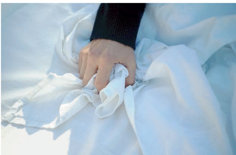
Τίτλος του χειρήματος είναι «BedSheets Art Project» και θα συνεχιστεί με μια έκθεση που αρχίζει στις 5/5 στην γκαλερί SG «St George» του Λυκαβηττού.