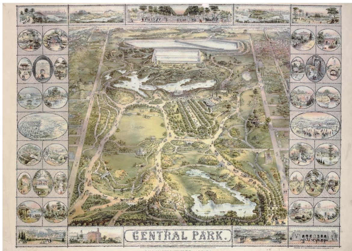
Χάρτης του Σέντραλ Παρκ, χρονολογούμενος στο 1863, από τη συλλογή της New York Public Library.

Οι χρήστες μπορούν να εστιάσουν σε συγκεκριμένα σημεία της πόλης, ακριβώς όπως θα έκαναν με έναν σύγχρονο ψηφιακό χάρτη, για να συγκρίνουν την εικόνα με τη σημερινή, εντοπίζουν τις αλλαγές που έχουν συντελεστεί στον αστικό ιστό ή να ανακαλύψουν σε ποιο σημείο