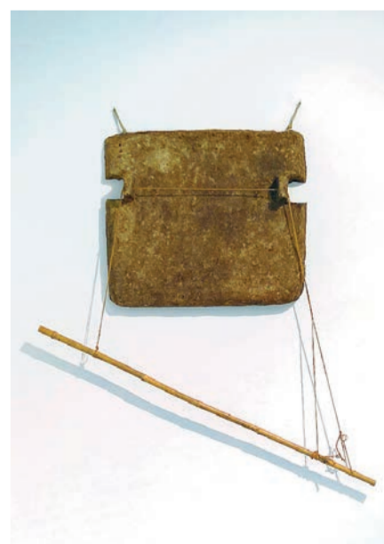
Ο Ρόμπερτ Ράουσενμπεργκ διαμόρφωσε νέο καλλιτεχνικό ρεύμα χρησιμοποιώντας διαφορετικά υλικά και μορφές έκφρασης.

Η πίστη του Ράουσενμπεργκ στη δύναμη της τέχνης ως καταλύτη θετικών κοινωνικών αλλαγών ήταν η κύρια αιτία της συμμετοχής του σε πολλαπλά διεθνή εικαστικά δράματα και εκθέσεις. Ιδιαίτερα τις δεκαετίες του 1970 και του 1980 ο καλλιτέχνης συνεργάζεται με κατασκευαστές χειροποίητων χαρτιών στη Γαλλία, την Ινδία και την Κίνα. Κατά τη διάρκεια των ταξιδιών του, συγκέντρωσε πολλά διαφορετικά υλικά, με σκοπό να τα χρησιμοποιήσει μετέπειτα στα έργα του. Το αποτέλεσμα ήταν να ενσωματωθεί στη δουλειά του η βαθιά κατανόηση που είχε για τους